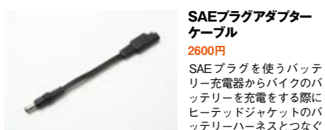
SAEプラグアダプター ケーブル 2600円 SAEプラグを使うバッテリー充電器からバイクのバッテリーを充電する際にヒートッドジャケットのバッテリーハーネスとつなぐ