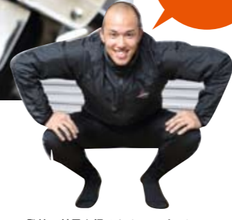
発熱の効果を得るためにはピッタリのサイズが最適。そのため、各アイテムごとに最大6つのサイズ展開がある