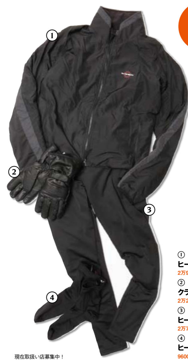
現在取扱い店募集中!