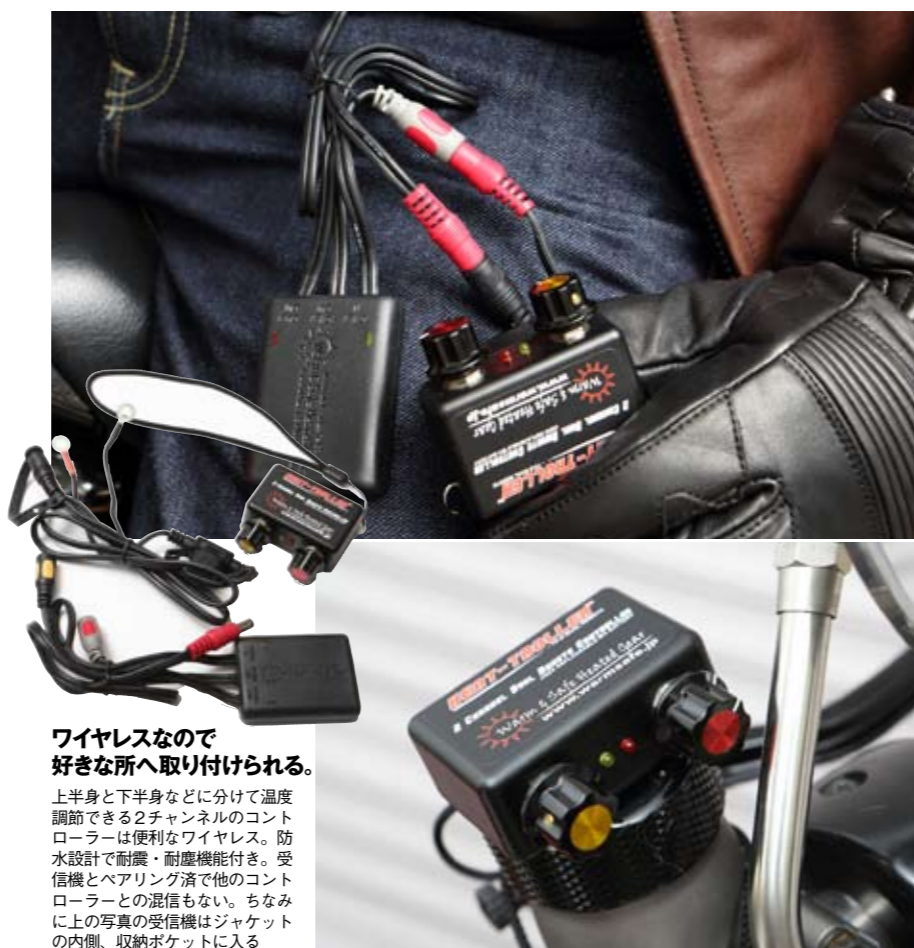
ワイヤレスなので 好きな所へ取り付けられる。 上半身と下半身などに分けて温度調節できる2チャンネルのコントローラーは便利なワイヤレス。防水設計で耐震・耐塵機能付き。受信機とペアリング済で他のコントローラーとの混信もない。ちなみに上の写真の受信機はジャケットの内側、収納ポケットに入る