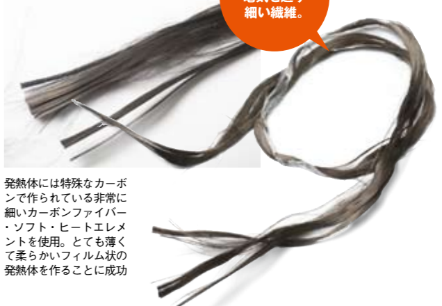
発熱体には特殊なカーボンで作られている非常に細いカーボンファイバー・ソフト・ヒートエレメントを使用。とても薄くて柔らかいフィルム状の発熱体を作ること成功