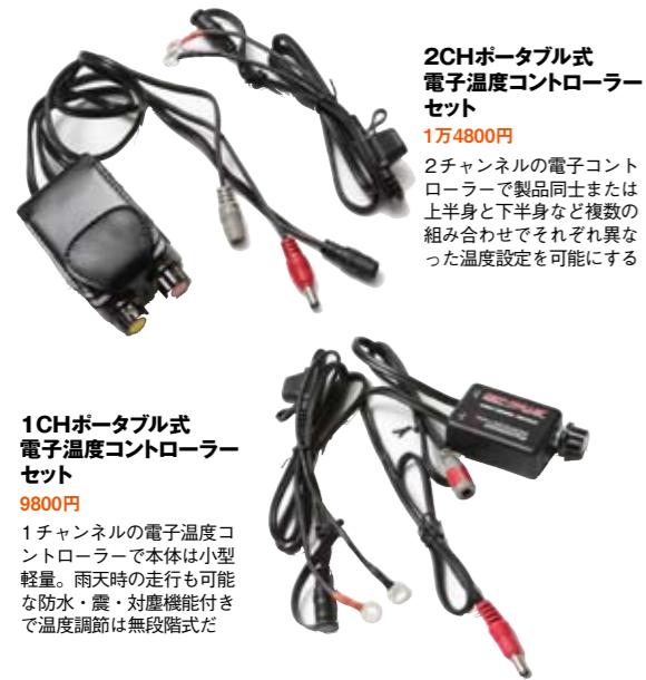
2CHポータブル式 電子温度コントローラー セット 1万4800円 2チャンネルの電子コントローラーで製品同士または上半身と下半身など複数の組み合わせでそれぞれ異なる温度設定を可能にする