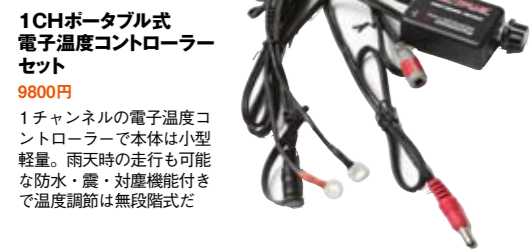
1CHポータブル式 電子温度コントローラー セット 9800円 1チャンネルの電子温度コントローラーで本体は小型軽量。雨天時の走行も可能な防水・塵・対策機能付きで温度調節は無段階式だ