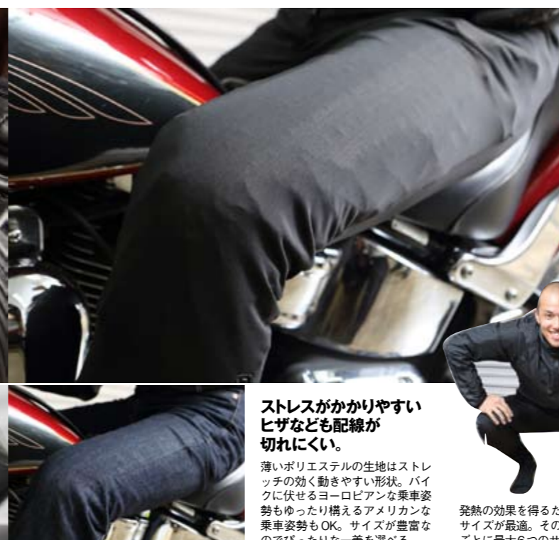
ストレスがかりやすい ヒザなども配線が 切れにくい。 薄いポリエステル生地はストレッチの効く動きやすい形状。バイクに伏せるヨーロッパ系乗車姿勢もゆったり構えるアメリカ系乗車姿勢もOK。サイズが豊富なのでぴったりな一着を選べる