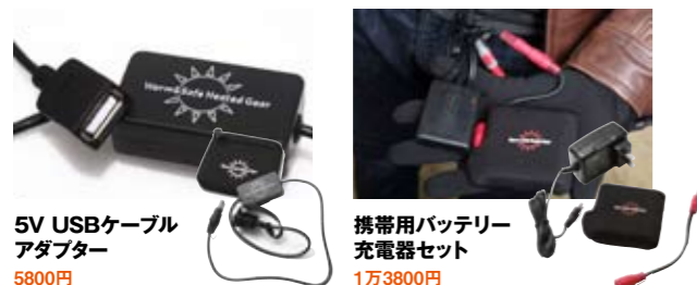
5V USBケーブル アダプター 5800円 iPadや携帯電話などのモバイル機器を充電するUSBケーブル。ジャケットなどのYケーブルに接続して使用