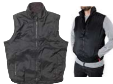
ヒートッド ベスト 2万1800円 短時間、短距離の走行時に重宝するヒートッドベスト。拡張用Yケーブルアダプターと収納ポーチが付属している。男女兼用のデザインとなっているのが特徴