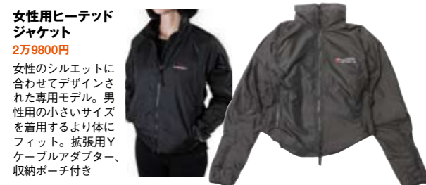
女性用ヒートッド ジャケット 2万9800円 女性のシルエットに合わせてデザインされた専用モデル。男性用の小さいサイズを着用するより体にフィット。拡張用Yケーブルアダプター、収納ポーチ付き